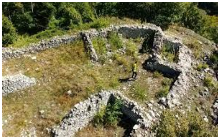
Castello di Sant'Angelo a Castiglione.