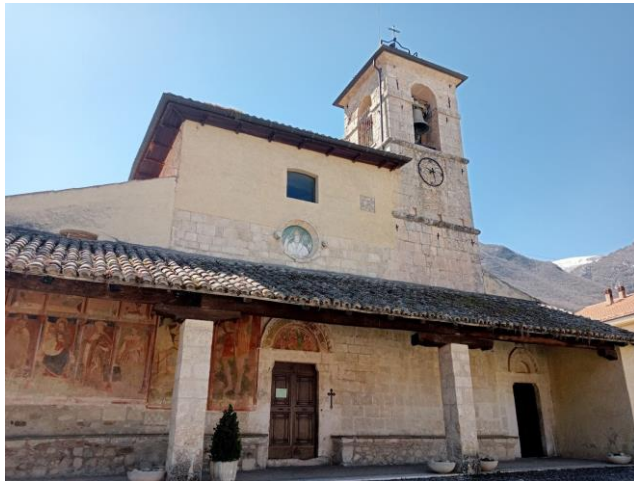
Foto San Panfilo sec.XI