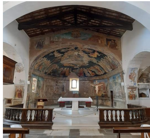
Affreschi di Saturnino Gatti