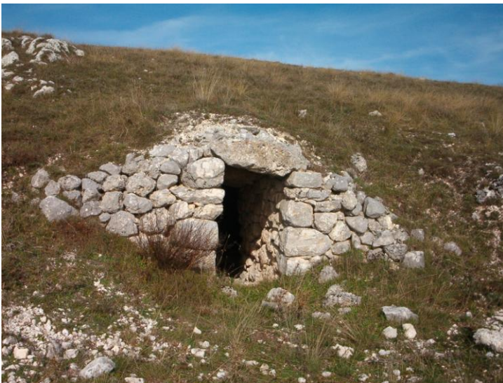
Grotta , Agro Pastorale