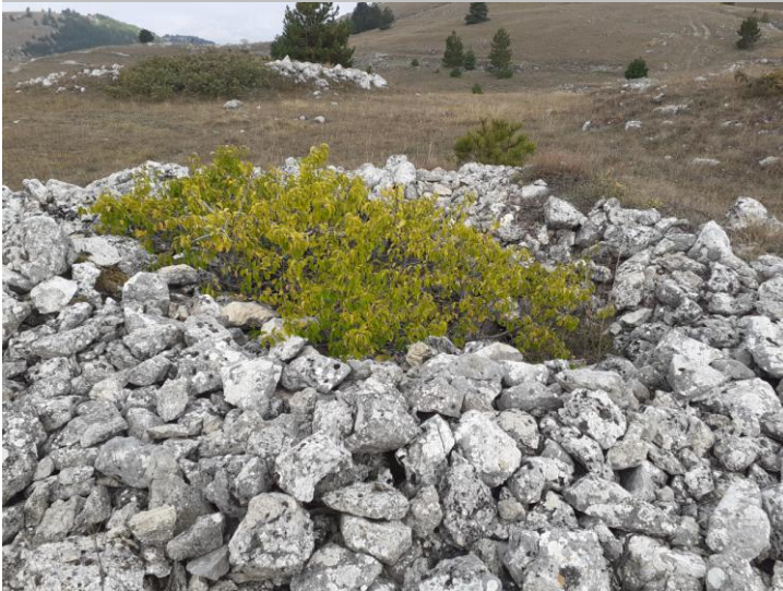
Tombe a tumulo Italiche